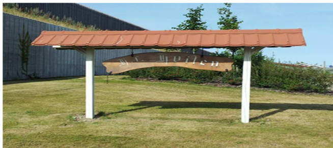
Hf. Hvilen, ww.hvilen.dk